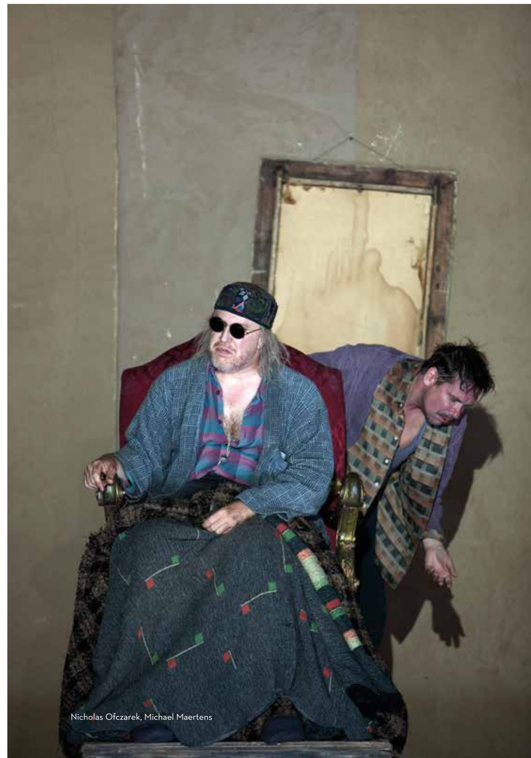
Nicholas Ofczarek, Michael Maertens

Aufführungsrechte: S. Fischer Verlag, Frankfurt am Main