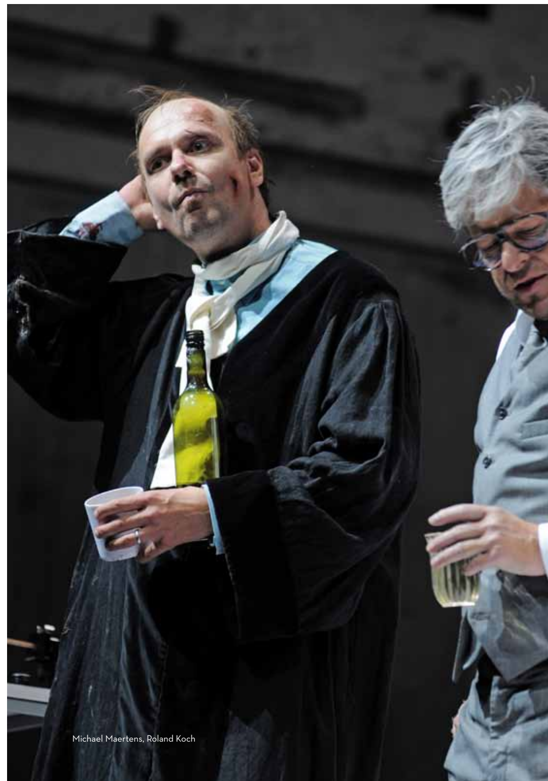
Michael Maertens, Roland Koch