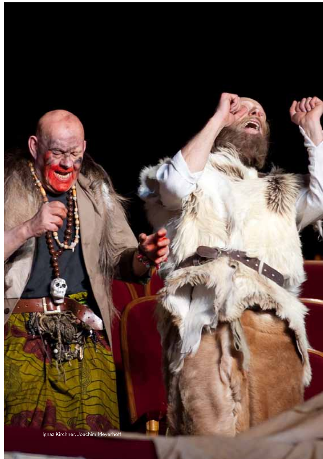
Ignaz Kirchner, Joachim Meyerhoff

Aufführungsrechte: S. Fischer Verlag, Frankfurt am Main