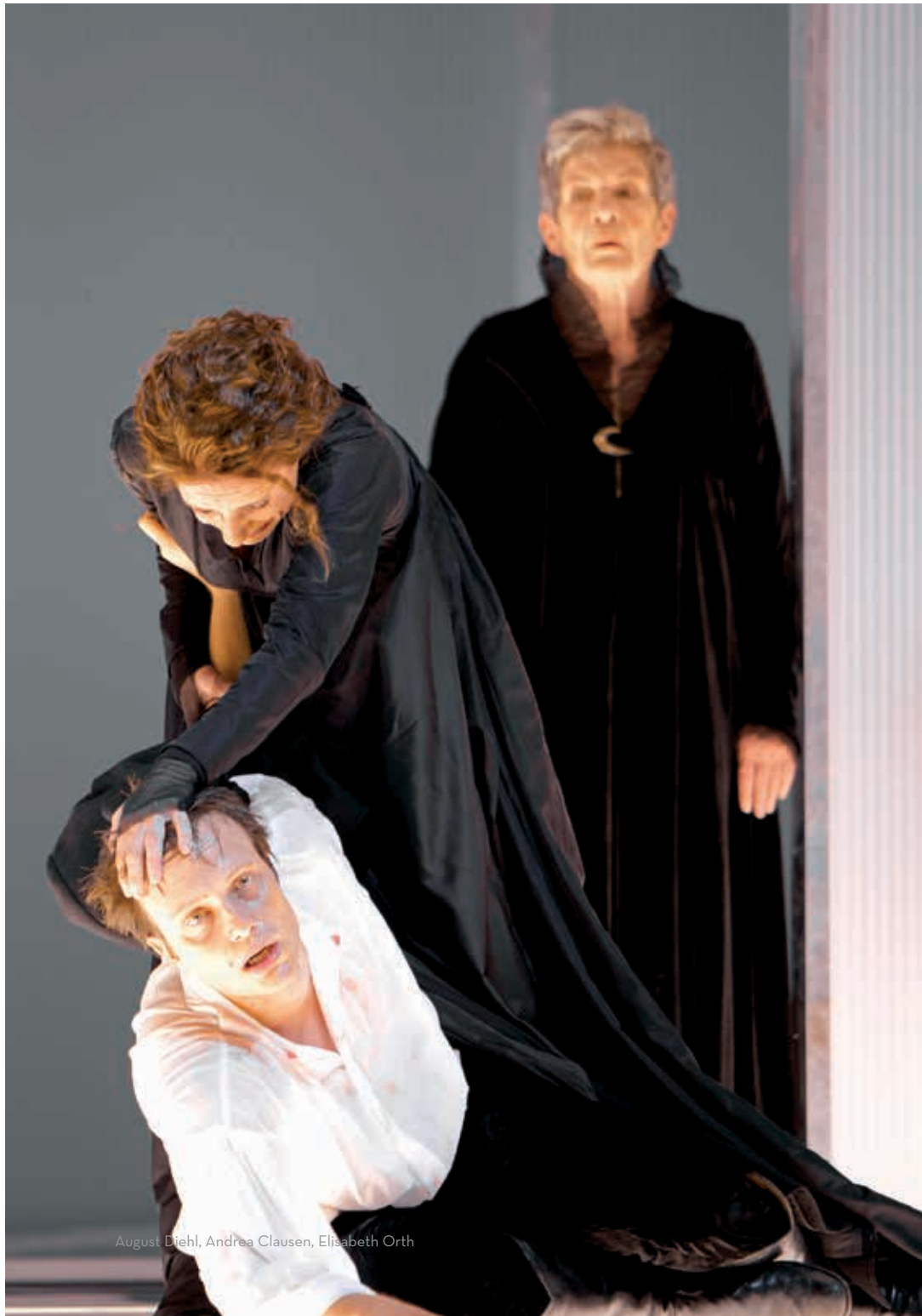
August Diehl, Andrea Clausen, Elisabeth Orth