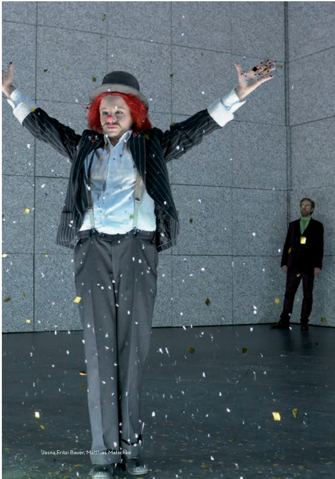
Jasna Fritzi Bauer, Matthias Matschke